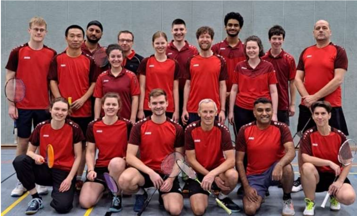
Selten auf einem gemeinsamen Bild zu sehen, doch beim Auswärtsspiel in Nürnberg hat es geklappt: unsere drei Erwachsenen-Mannschaften.

Noch nie zuvor in der 25-jährigen Geschichte der Badminton-Abteilung hatte der SC Uttenreuth zwei Teams in der Bezirksliga – und so wie es im Moment aussieht, dürfte es keine Momentaufnahme bleiben: Denn beide Mannschaften schlagen sich gut und nehmen Kurs auf den Klassenerhalt. Zwar musste die 1. Mannschaft am Februar-Spielwochenende zwei Niederlagen hinnehmen, mit acht Punkten hat sie insgesamt aber einen deutlichen Vorsprung vor dem Tabellenletzten TV 1848 Erlangen.