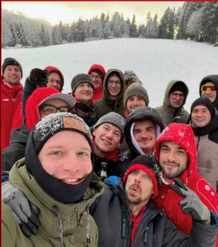
Teambuilding der Fußballer im Bayerischen Wald