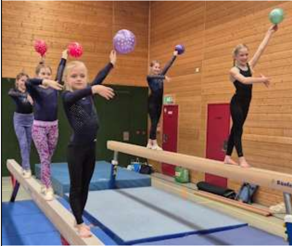
Bild links: Ausdrucksstarke Posen sind neben körperlicher Gewandtheit das A und O des Geräteturnens.

Im Folgenden weitere Impressionen von der Nikolausfeier: