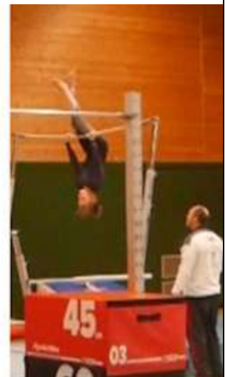
Bilder oben: Momentaufnahmen von den Übungen der Fortgeschrittenen Bild unten: Gruppenfoto der Beteiligten